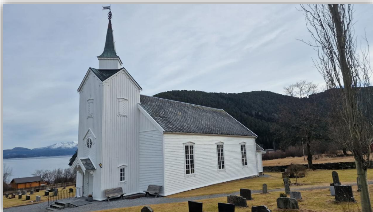
Vågstranda kyrkje, etter oppgradering i 2025