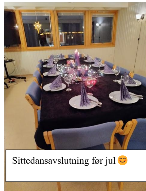
Sittedansavslutning før jul 😊